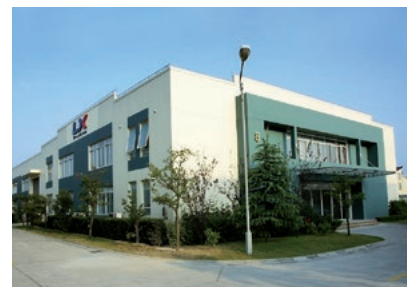
Site de l'entreprise à Shanghai

LX Precision (Shanghai) Co., Ltd. No. 8, Lane 88, Yuan Shan Road, 201108, Shanghai, China www.lxprecision.com , info@lxprecision.com