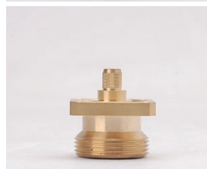
Extrait de la gamme de produits