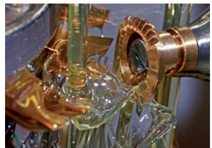
Propre production et montage

Développement, fabrication et distribution d'exécutions standards et particulières de composants de denture, pignons, vérins à vis et transmissions à roues coniques, transmissions spéciales ainsi que d'autres composants de la technique d'entraînement.