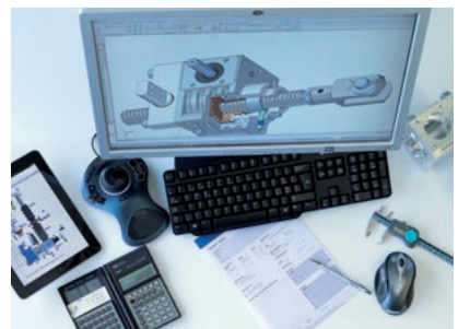
Une solution d'entraînement pour chaque situation