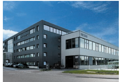
Site de production à Pfäffikon (ZH)