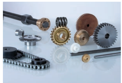
Gamme standard de pièces standardisées

Barzloostrasse 1, 8330 Pfäffikon (ZH) www.nozag.ch, info@nozag.ch