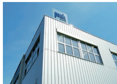
Standort in Altstätten