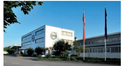
Standort in Hunzenschwil